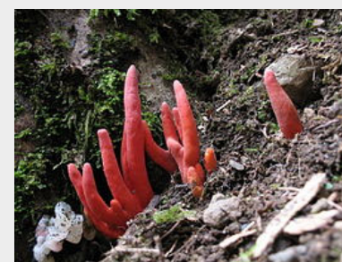
カエントケ ブナ、ナラに地上から指が出ているように発生します。