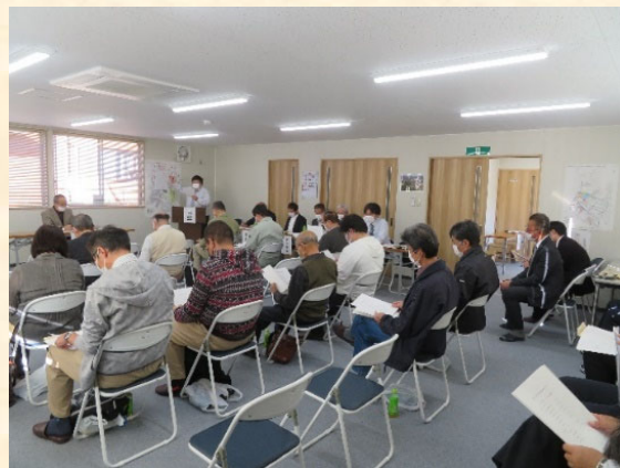
事業計画変更の説明をしている様子